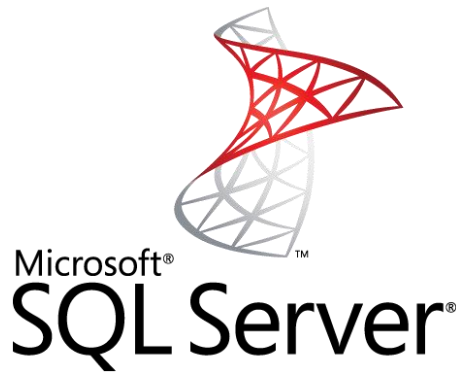
Şekil 2.1. SQL Server Logosu

Microsoft SQL Server en çok kullanılan veritabanı sunucu yazılımıdır. Veritabanlarının oluşturulmasını ve yönetilmesini sağlayan kurumsal çaplı Veritabanı Yönetim Sistemidir. Dünyada en yoğun kullanılan yönetim sistemi SQL Server'dır. SQL Server'ı kullanarak verilerinizi dilediğiniz şekilde yönetebilir ve Stored prosedürleri kullanarak çok sayıda ve komplike sonuçlar döndürebilirsiniz. Böylece istediğiniz verileri raporlayarak elde edebilirsiniz.