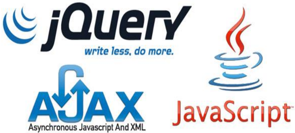
Şekil 2.5. Kullanılan Teknolojilerin Logoları

Ana yapısı javascript olsa da JQuery kütüphanesine ihtiyaç duyar. Javascript kodlarını kısaltması ve yapısının kolaylığı ile öğrenmek o kadar da zor değil. Biraz yazılım altyapınız olması yeterli olacaktır.