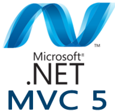
řekil 2.4. Microsoft Asp.NET MVC 5 Logosu

MVC uzun yıllardır bir çok framework'te ve programlama dilinde kullanılmış (Java, PHP, vb.) ve olgunlaşmış bir desendir. ASP.NET MVC sayesinde .Net framework dilleri ile MVC pattern kullanılarak hızlı çalışın, test edilebilir, tekrar kullanılabilir parçaları olabilen web uygulamaları geliřtirilebilmesi sağlanmıştır.